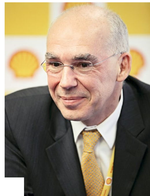
Оливье Лазар, председатель концерна «Шелл» в России

«Мировая практика реализации СПГ-проектов убедительно показывает, что расширение существующих мощностей СПГ будет намного дешевле и потребует меньше времени по сравнению с проектами с нуля», — подчеркнул Оливье Лазар. — С учетом уже существующей инфраструктуры, третья технологическая линия СПГ на Сахалине может быть введена в эксплуатацию быстро и при относительно небольших затратах».