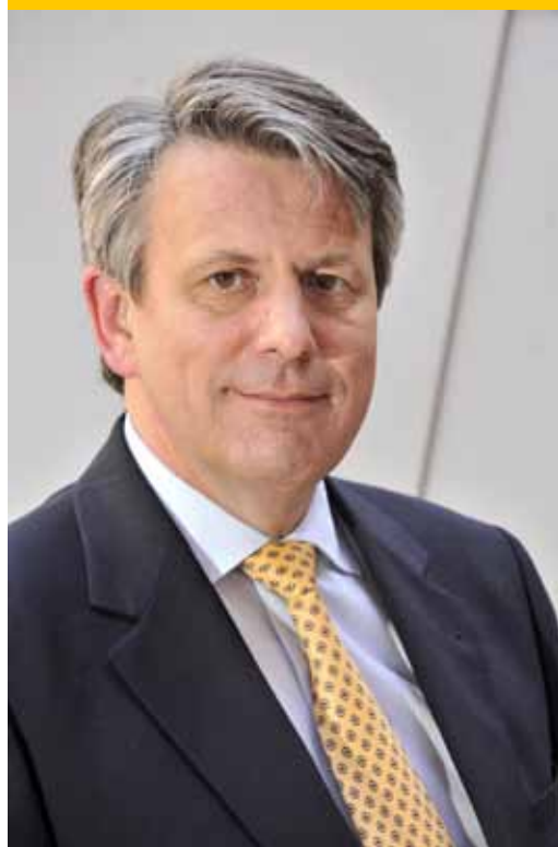
Бен ван Бёрден, новый главный исполнительный директор концерна «Шелл» с января 2014 года

ЕЖЕКВАРТАЛЬНОЕ ИЗДАНИЕ КОМПАНИЙ КОНЦЕРНА «ШЕЛЛ» В РОССИИ