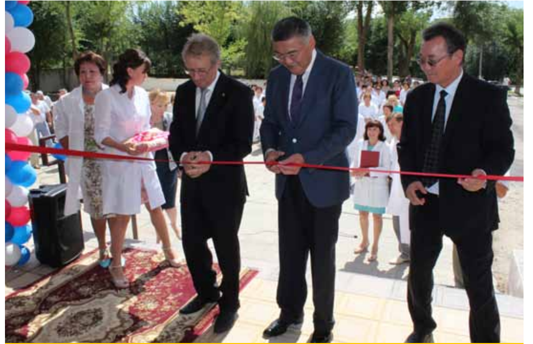
Слева направо: генеральный директор компании «Шелл Нефтегаз Девелопмент» (ИИ) Евгений Бояршин, глава Республики Калмыкия Алексей Орлов

Помощь в проведении капитального ремонта перинатального центра осуществлялась в рамках социально-экономического соглашения, подписанного 29 марта 2013 года между компанией «Шелл Нефтегаз Девелопмент» (ИИ) и Правительством Республики Калмыкия.